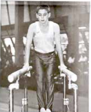
Auch in der Kunst - und Kunst in der Natur.