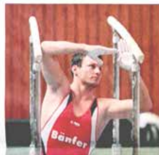
Die gute Vorbereitung ist alles, damit im Wettbewerb ein Bester nicht schief geht. Der Abstand zur Normalzeit wird dann genau einstrich ausgeglichen.