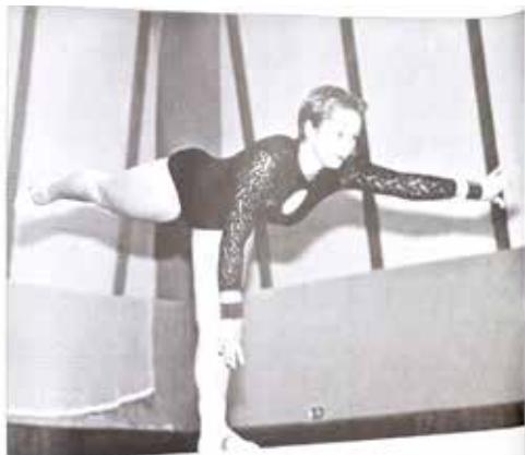
Stausee spielte vor gewagte Darbietungen neben die jährlichen Zusätze.