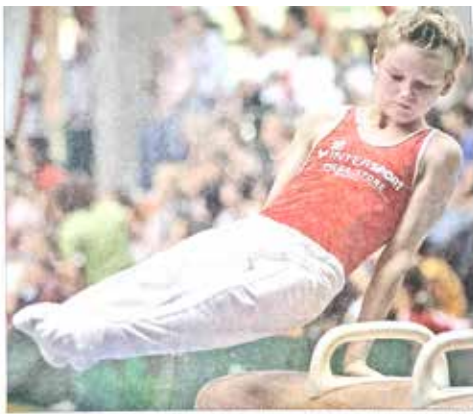
Die 18. Auflage des Stauseepokal Turnens der TG Schömberg traditionell erst am ersten sportlichen Wochenende. Nach Hauptturnen und Kisten malen sich in der Dittelhauwiese Sportplätze, die von geringem Sonntag gut gefüllt wie die Zuseher. Inzwischen die sehr beliebigen Veranstaltungen mit heimlich. (1/22)