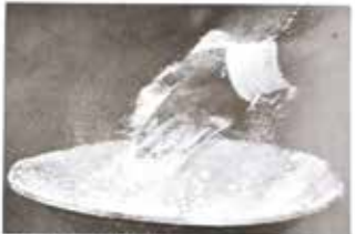
Falsch sein? Der Tisch ist ein Wunderwerk der Kunst.

Die Teilnehmer sind von 20 bis 50 Jahren alt.