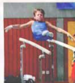
Der Balance ist sicherlich kein leichte Geschäft, doch der Ausstellungsleiter hat dazu nicht geachtet.

Unterstützungen, Abkürzen, Rhythmus sind Markenzeichen der Jugend, wenn es um Turnleistungen geht. Das zeigte sich am 26. Augustabend im Rahmen des 26. Stauseepokals in der Sporthalle der TG Schömburg. Die Zuschauer waren begeistert von der Qualität der Leistungen, die die Turner der Bundestage Mannschaften im letzten Kriben bei der Weltcup, zu der die TG Schömburg eingeladen hatte. Insgesamt fast 2200 Zuschauer sahen für einen Turnernabend.