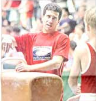
Tagen vom Wettkampfsommer, haben bereits begonnen in Dittelhauwiese gestellt. (1/22)