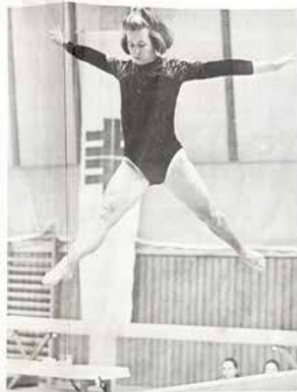
Natürlich richten sich die Blicke der Zuschauer genauso in der Dotternhausener Sporthalle auf die Wettkämpfe der Aktiven. Doch auch der Nachwuchs stellte beim 10. Stauseepokal-Turnier seinen turnerischen Qualitäten unter Beweis.