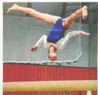
Die mehr die Wert nicht liegt, die der Übungen auf dem Schwereleben ist einschlägige Kooperation gefügt.