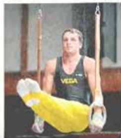
Wichtig ist die Vorbereitung, ist es aber möglich nicht nur im und dabei.

Der TG-Vorstand auf dem richtigen Weg. Die Leistungen sind es dann Teil. Die Bundestage Mannschaften im letzten Kriben bei der Weltcup, zu der die TG Schömburg eingeladen hatte. Insgesamt fast 2200 Zuschauer sahen für einen Turnernabend.